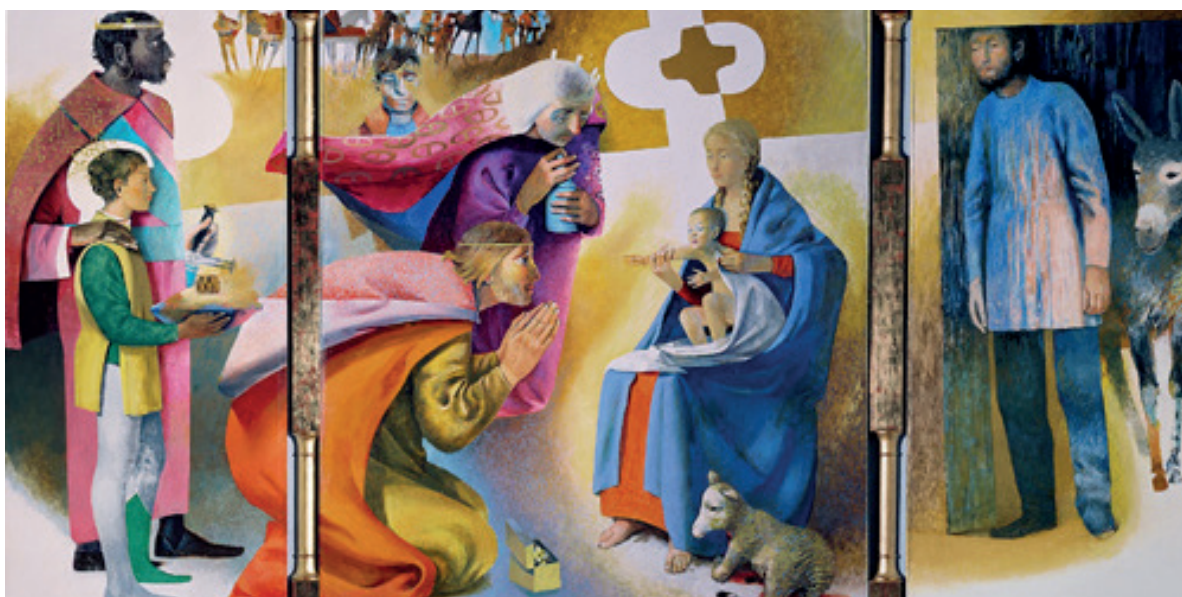
Adoration des Mages d'Arcabas

Nous aussi, nous venons avec nos pauvres dons, nos « oui » au Seigneur, cherchant à faire sa volonté dans nos vies. Mais n'est-ce pas plutôt l'Enfant de la Crèche qui nous offre ses dons : Sa présence ravive notre foi ; Sa venue dans notre humanité annonce déjà sa mort et sa résurrection et les nôtres futures, ravive notre espérance ; L'amour dont il rayonne, nous rappelle qu'il n'est qu'Amour, et ravive notre charité. Avec les mages, avec Marie et Joseph, repartons par le chemin qui mène avec le Christ, vers le Père, dans l'Esprit.