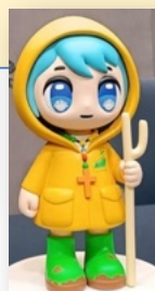
Luce , mascotte du Jubilé 2025

À tous nos lecteurs et rédacteurs, à tous les pèlerins d'espérance, Joyeux Noël, Belle et Sainte Année Jubilaire 2025 ! (Le comité de rédaction)