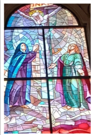
Vitrail église Ostuni - Pouilles - Italie Page de couverture : Procession du 15 août 2024 Estivales à Nevers.