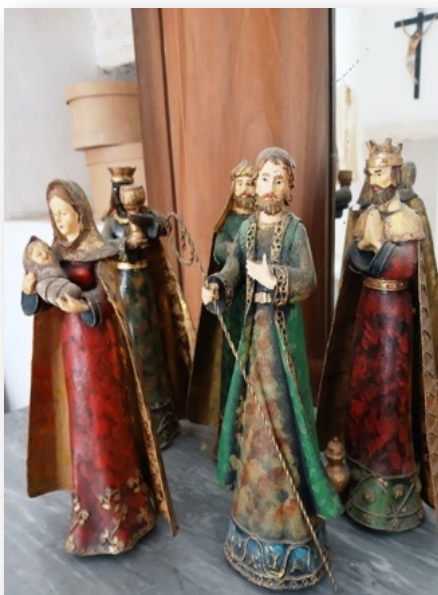
Marie et l'Enfant avec les Rois Mages. Carton-pâte (« cartapesta ») dans une chambre d'un trullo en Italie (Pouilles).