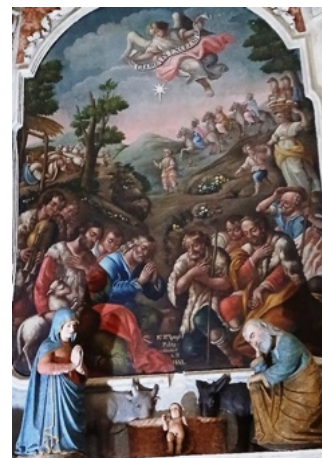
Nativité- Pouilles - Italie- Région de Fasano