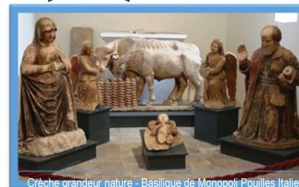
Crèche grandeur nature - Basilique de Monopoli Pouilles Italie

Joyeux Noël ! « Noël nous rappelle que Dieu nous aime et veut être avec nous. C'est pourquoi Jésus est né, s'est fait petit, a vécu dans une famille avec Marie et Joseph, et continue d'être présent à nos côtés et en chacun de nous. » Pape François