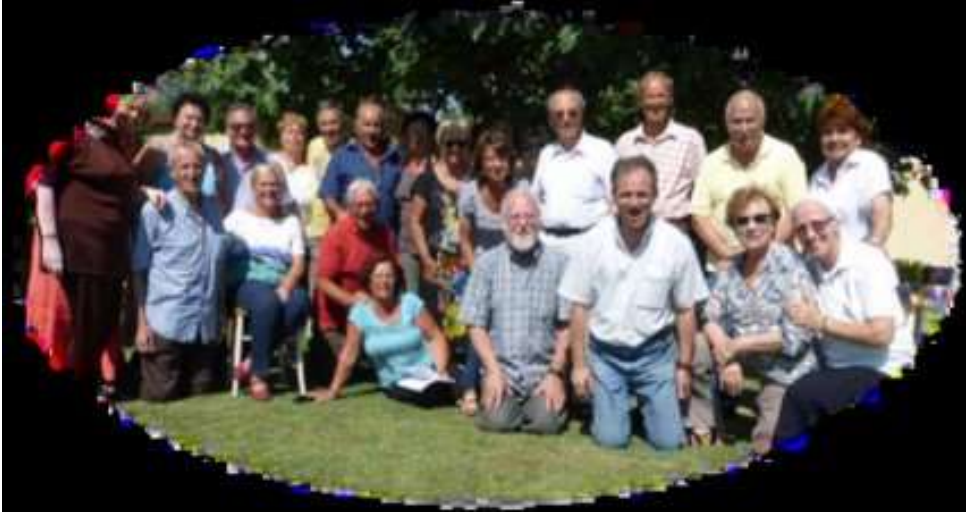
Fraternité Faustino - Rome (Italie)