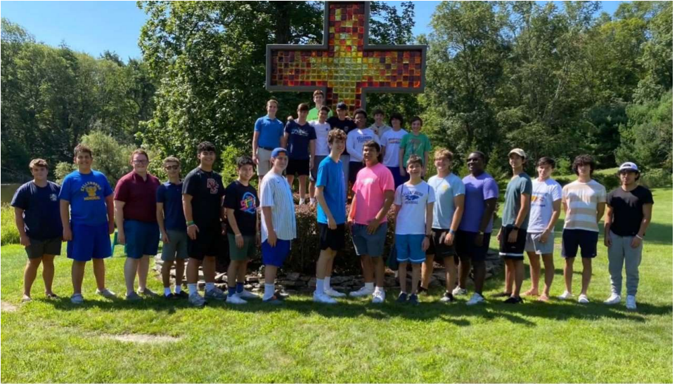
Membres du "Faustino Club". Capture d'écran de la newsletter "Magnificat".