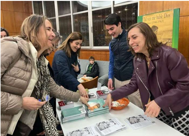
Dans le foyer, un stand vend des souvenirs sur Faustino.

Célébration de l'anniversaire de la mort de Faustino, le 3 mars : Le 3 mars dernier, l'anniversaire de la mort du Vénérable Faustino Pérez-Manglano a été célébré au "Colegio del Pilar". Il a été rappelé lors de deux eucharisties, à midi et à 20h30, qui ont eu lieu dans la chapelle du collège, avec la participation des membres de la "communauté de foi" du Pilar. Des membres de la famille du Vénérable Faustino (Valence, Espagne) étaient également présents.