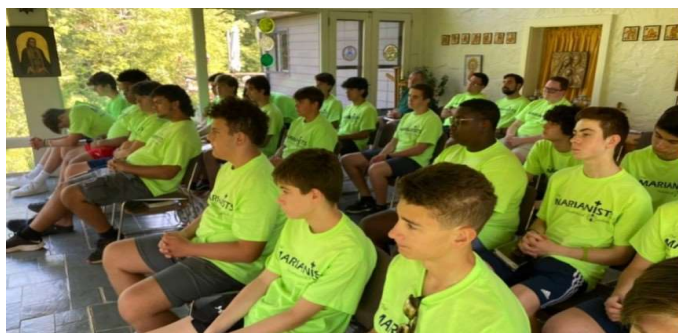
Des jeunes du "Marianist Chaminade High School" et du "Kellenberg Memorial High School" à Mineola, NY (USA) se réunissent en mars pour discuter de la vocation dans le Club Faustino dont ils sont membres.

Les écoles marianistes de la Province de Meribah (NY, USA) ont formé des Clubs Faustino et Adele très populaires. Plusieurs centaines de jeunes participent régulièrement à des activités spirituelles, au service de la mission et à des activités d'aide au discernement.