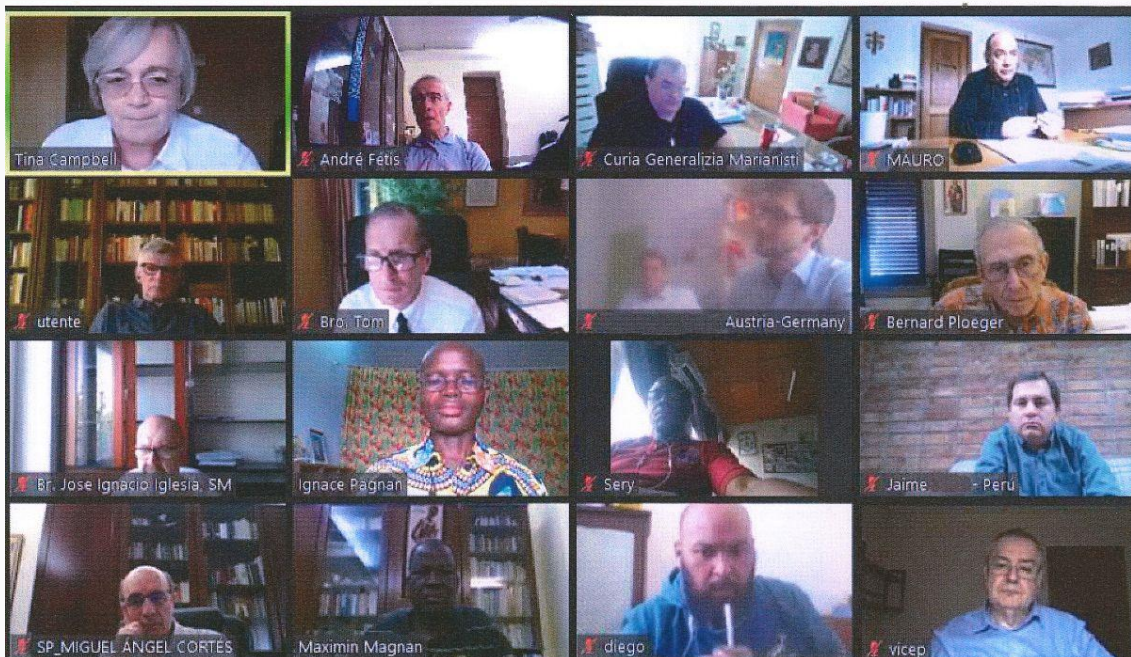
Quelques participants à la formation