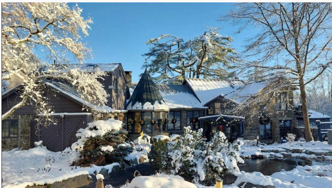
Founders Hollow, la Maison de retraite des Marianistes, recouverte de neige.

liées à leurs œuvres éducatives, et la troisième est une communauté de frères retraités. La Province gère trois grandes écoles : Chaminade High School (Mineola), Kellenberg Memorial High School (Uniondale) et St. Martin de Porres Marianist School (Uniondale). Ils sont aidés par des collaborateurs laïcs extraordinairement dévoués. Ensemble, ce sont plus de 4500 élèves qui reçoivent une éducation marianiste à Long Island. En plus des écoles, la Province gère cinq maisons de retraites. Deux à Long Island pour chacune des écoles secondaires, et une qui est partagée entre elles, située à environ trois heures au nord de New York City. Au cours de l'année scolaire, plus de deux cent cinquante retraites sont organisées pour les classes, les clubs scolaires, les équipes sportives de l'école, les anciens élèves et la pastorale des vocations.