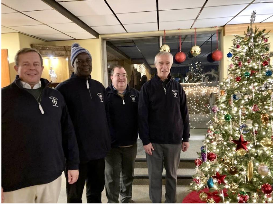
Les membres du Conseil général arborant les blousons reçus lors de leur dîner d'adieu.

Le Conseil général a été heureux de passer ces semaines avec les membres de la Province. C'était un moment spécial, car ils ont également pu vivre ensemble le temps de l'Avent. Nous sommes reconnaissants à la Province pour son hospitalité fraternelle et sommes assurés de nos prières pour ses membres et ses œuvres apostoliques.