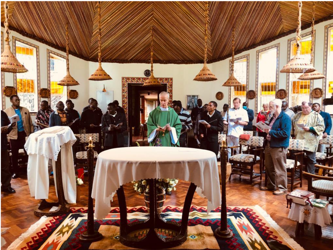
Célébration de l'Eucharistie lors d'une assemblée de religieux marianistes à Nairobi.

Les quatre membres du Conseil général viennent de rentrer de leur visite dans la Région d'Afrique de l'Est. La visite a débuté le 9 octobre et s'est achevée le 28 octobre, date à laquelle ils sont rentrés à Rome. Grâce à une organisation rapide et souple de la part de l'Administration régionale et de ses membres, cette visite a été organisée avec succès dans un délai relativement court. Elle s'est substituée à la visite prévue dans la province des États-Unis, qui a dû être annulée en raison de la pandémie. Cette visite a néanmoins été difficile à programmer, voire à effectuer, compte tenu de toutes les restrictions en vigueur dans les différents pays.