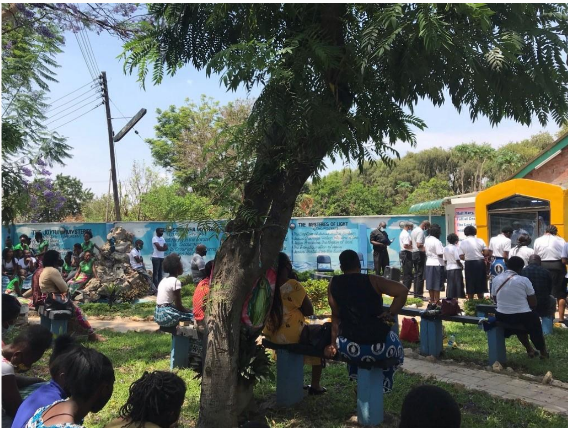
Célébration de la Journée mondiale de prière marianiste à l'école Matero Boys en Zambie.

Au Kenya, les religieux de la Région dirigent plusieurs institutions éducatives, à Nairobi, Mombasa et Ukunda. L'une d'entre elles, l'école Our Lady of Nazareth , dispense une éducation formelle aux élèves de maternelle et primaire du bidonville Mukuru. Plusieurs autres centres, dans les trois villes, dispensent une formation professionnelle à la fois formelle et non-formelle. À Mombasa, la SM anime la paroisse St. Martin de Porres. D'autres œuvres sociales sont aussi animées par la SM. Toutes ces œuvres bénéficient de la collaboration de laïcs très dévoués et servent les nécessiteux avec respect et dévouement. Le Kenya accueille deux des trois communautés de formation de la Région. Actuellement, le scolasticat compte 22 religieux, la plupart d'entre eux venant d'Afrique de l'Est, mais aussi de plusieurs autres Unités d'Afrique. Le noviciat compte deux novices. En outre, il existe des groupes actifs de Communautés Laïques Marianistes à Mombasa et à Nairobi.