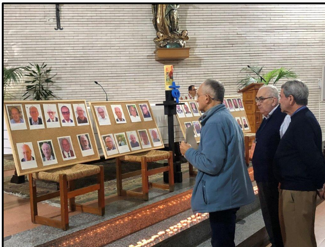
En souvenir de nos frères décédés

Nous remercions la Conférence Européenne Marianiste et ceux qui ont contribué à l'organisation de cet événement pour leur travail et les soucis d'en faire une expérience riche et agréable.