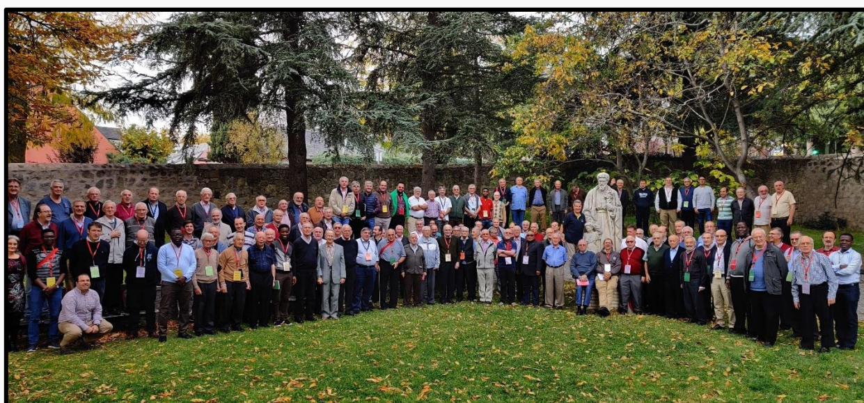
Participants à la réunion du CEM

Il y a quelques années, la Conférence Européenne Marianiste, dans le but de construire une fraternité et un soutien mutuel parmi les membres des Unités européennes de la SM, a organisé une rencontre des religieux à Lourdes en France. Ce fut une expérience merveilleuse pour tous, et au cours de son évaluation, d'autres rencontres de ce genre furent souhaitées. Ainsi, à la fin d'octobre 2019, le second rassemblement eut lieu, cette fois-ci à l'Escorial, Espagne, avec la participation de 117 religieux. Le Conseil général a eu le privilège de participer à ces deux rencontres.