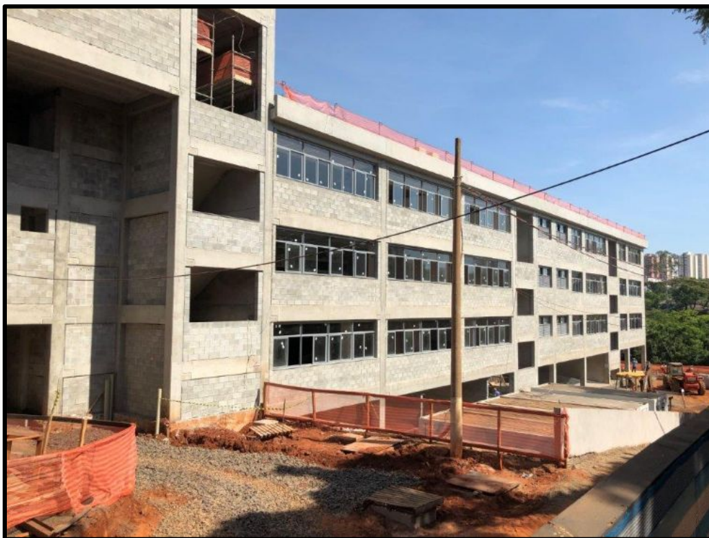
Un des pavillons de la nouvelle école marianiste de Baurú, actuellement en construction.

Nous remercions les membres du Secteur pour leur accueil vraiment fraternel et leur engagement à long terme dans la mission au Brésil. Nous demandons à tous les membres de la SM de les porter dans la prière tout au long de l'année et demie où ils vont opérer cette transition.