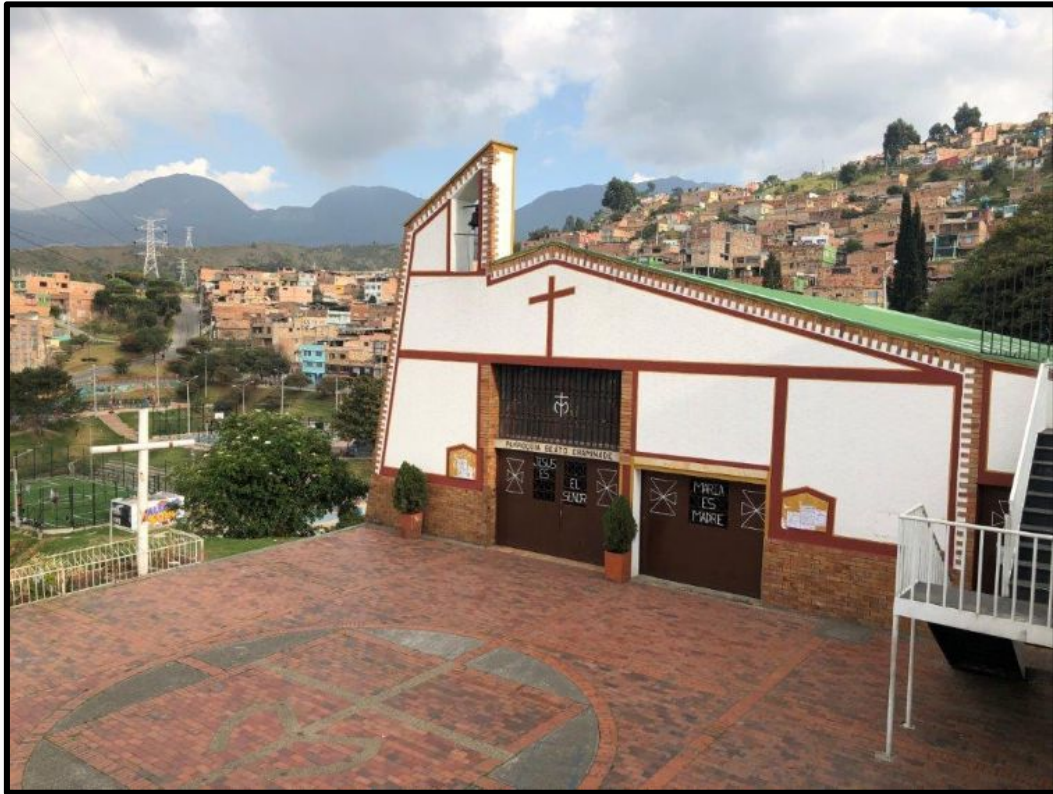
Paroisse du Bienheureux Chaminade à Palermo Sur, Bogotá, Colombie.

Le 3 février 2019, les quatre membres du Conseil général sont arrivés à Bogota, Colombie. Deux venait de leur visite au Brésil, et les deux autres de Cuba. Ils commençaient ensemble une visite de la Région de Colombie-Equateur, durée jusqu'au 19 février.