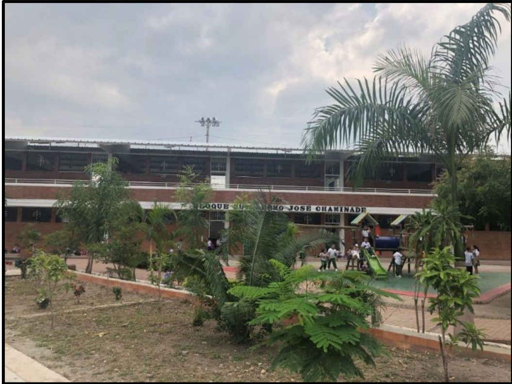
Pavillon Chaminade au Colegio Espiritu Santo à Girardot, en Colombie.