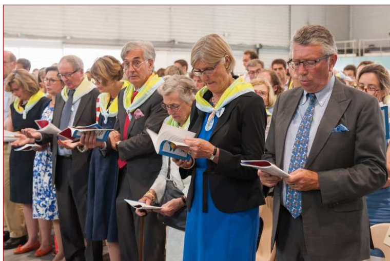
Famille et parenté actuelle de mère Adèle.

La famille d'Adèle était également très présente au cours des célébrations. La sainteté d'Adèle a pris racine dans la force de vie chrétienne d'une famille. Ce souffle a traversé les générations jusqu'aux générations actuelles, venues célébrer avec émotion leur illustre parente.