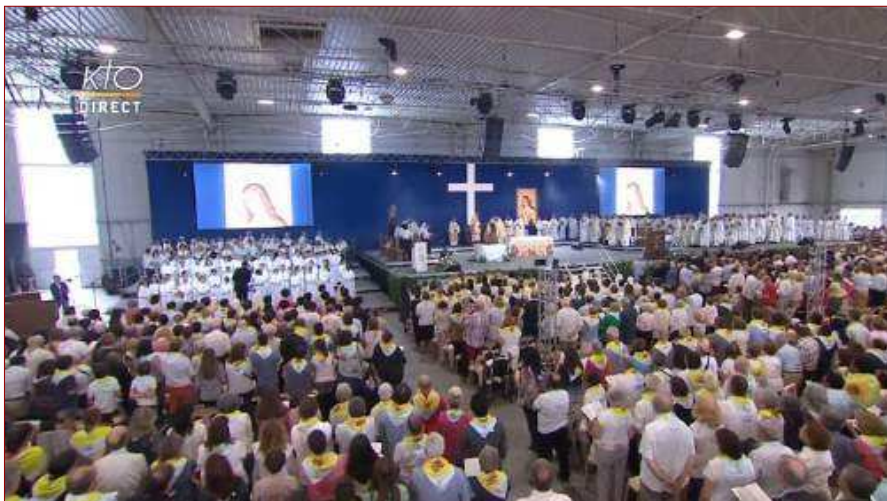
Vue générale de l'assemblée pendant la messe de béatification.