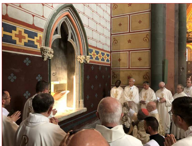
A la fin de la messe d'action de grâce à la cathédrale d'Agen, le cardinal Sarah encense les reliques de la bienheureuse Marie de la Conception.