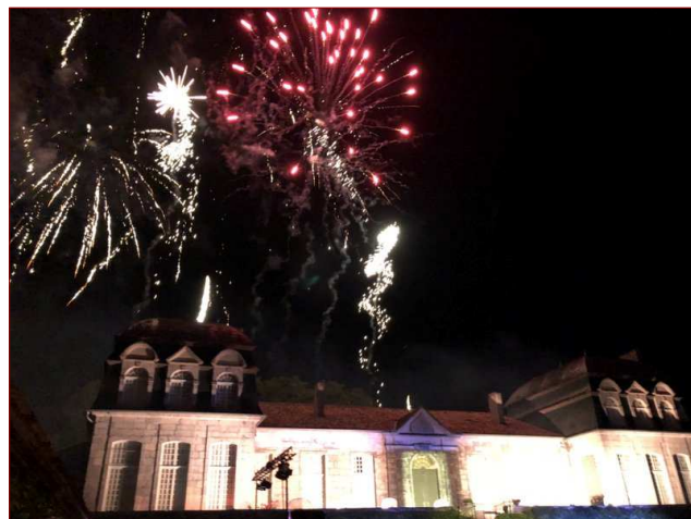
Feu d'artifice sur le château de Trenquelléon à la fin du spectacle.