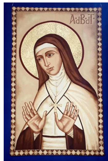
Tapisserie avec l'effigie de la nouvelle bienheureuse, Mère Marie de la Conception.