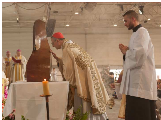
Le cardinal Amato vénère les reliques de Mère Adèle à la fin de la messe de béatification.