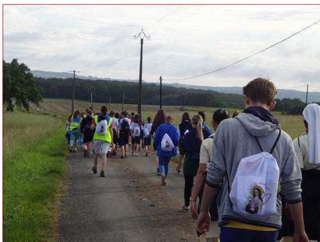
Pèlerinage des jeunes durant la béatification.

Les jeunes présents à la marche étaient venus du collège Sainte-Foy d'Agen, animé par les sœurs, mais aussi, pour beaucoup, de paroisses de tout de diocèse. C'est le fruit d'un travail généreux et patient de l'évêque d'Agen, Mgr Herbreteau, qui a tenu, avant la béatification, à aller présenter Adèle dans toutes les paroisses de son diocèse ou lors des rassemblements de jeunes ou des célébrations de confirmation. La figure d'Adèle est ainsi devenue plus familière pour beaucoup et l'enracinement de sa sainteté dans