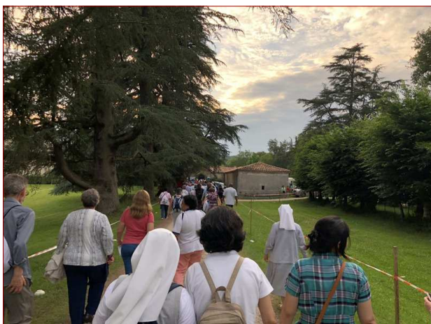
Arrivée des pèlerins au château de Trenquelléon pour le spectacle théâtral sur la vie d'Adèle.