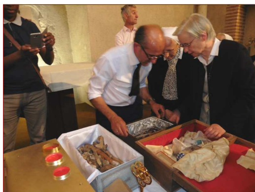
Coffre contenant les reliques de Mère Adèle.