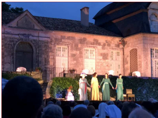
Représentation théâtrale de la vie de la jeune Adèle au château de Trenquelléon.