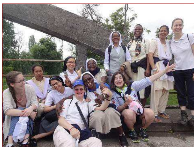
Un groupe de jeunes religieuses marianistes pendant la béatification.

ce terroir en est devenu plus manifeste. Son caractère, sa personnalité et sa générosité parlent au cœur des jeunes d'aujourd'hui : en fondant la "Petite société", elle avait fait de l'amitié un chemin de rencontre de Dieu, elle continue à le faire aujourd'hui.