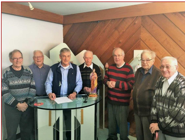
Le Conseil régional signe la demande de transition vers une Communauté territoriale à la chapelle de la communauté de Lévis, le 2 avril 2018.

lité : en devenant une communauté, ils n'ont plus besoin de la « pesanteur » des structures requises aux Provinces et aux Régions par la Règle et le Droit.