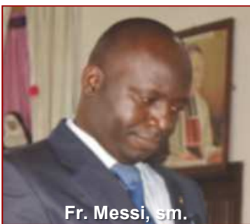
Fr. Messi, sm.

« Ce jour que fit le Seigneur est un jour de fête et de joie ! »