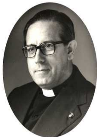
11 ème Supérieur Général 1981-1991

Je demande pardon à tous ceux que j'ai pu offenser, de quelque manière que ce soit, inconsciemment bien sûr, ou si je n'ai pas été en mesure de leur donner ce qu'ils auraient pu attendre de moi en tant que personne, en tant que religieux ou comme prêtre.