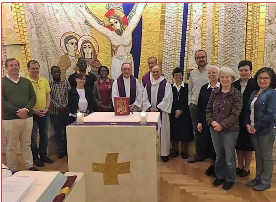
Le groupe dans la petite chapelle de l'Administration générale à Rome, Italie.