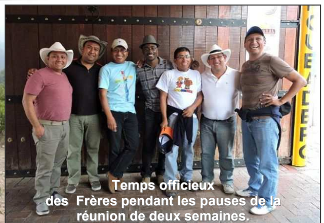
Temps officieux des Frères pendant les pauses de la réunion de deux semaines.