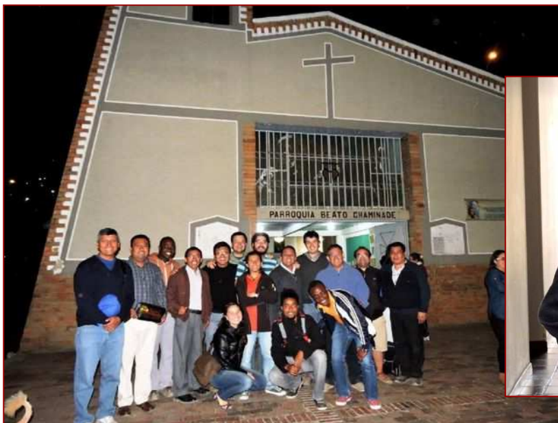
Devant la Paroisse Beato (Bx) Chaminade, à Bogotá.