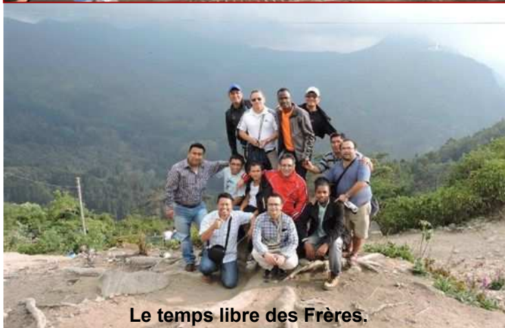
Le temps libre des Frères.