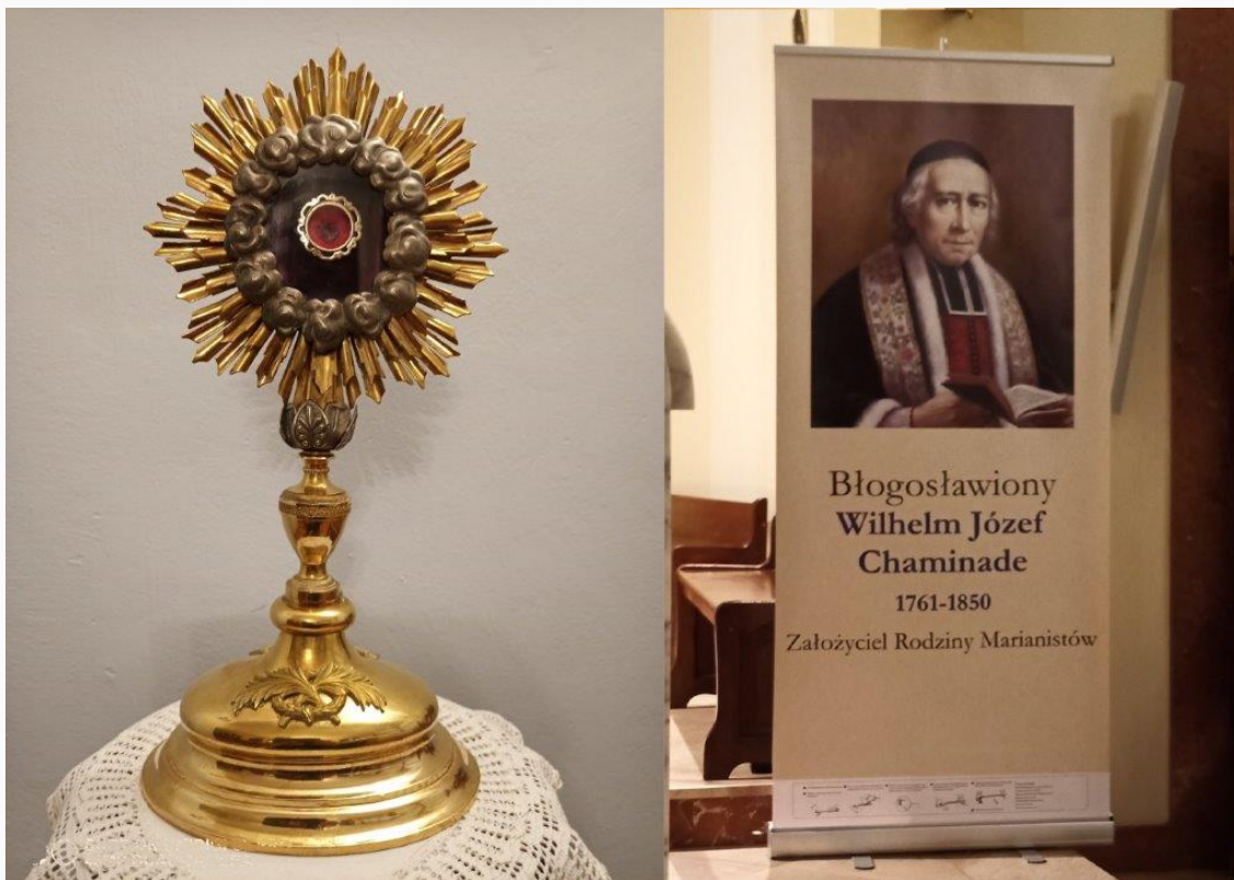
La relique du Bx G.-Joseph et un panneau placé dans l'église paroissiale pour la célébration.