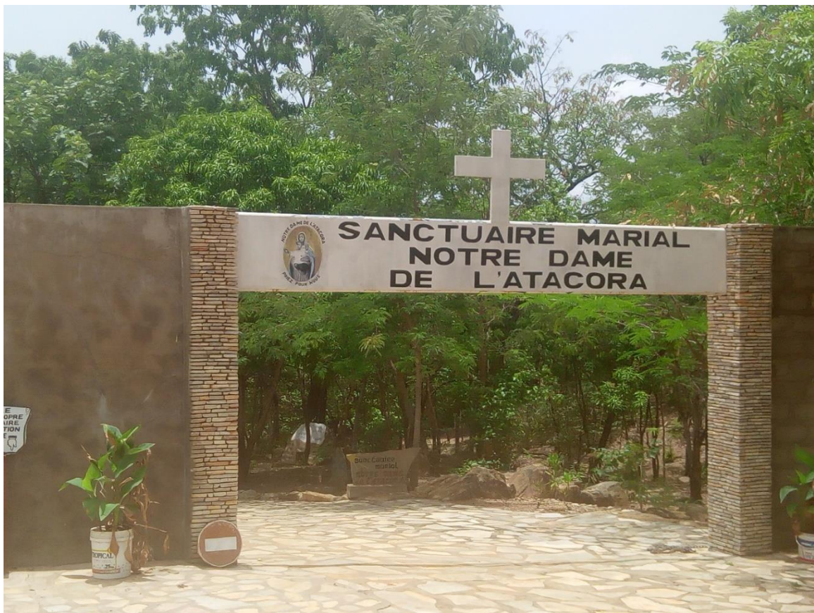
Entrée du sanctuaire

LIEU : NATITINGOU, AU BENIN (Afrique de l'Ouest)