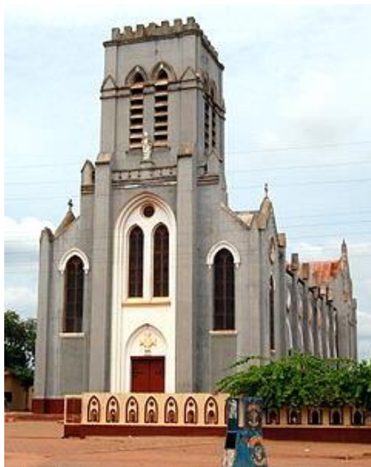
Cathédrale de Ouidah

Les statistiques de 2010 donnent 2.800.000 baptisés dans le pays dont 778 prêtres et 1510 religieux et religieuses.