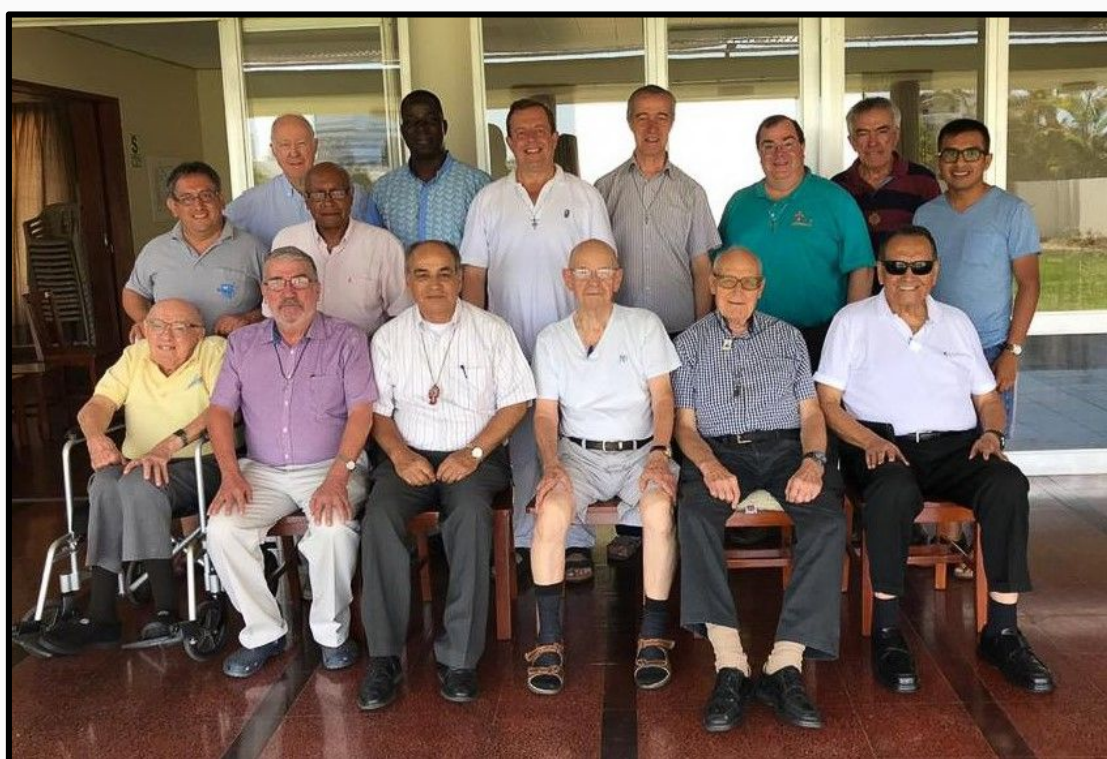
Membres de la Région du Pérou avec le Conseil général

Du 19 février au 12 mars, les quatre membres du Conseil général ont visité la Région du Pérou. Ils sont arrivés ensemble de Bogota, Colombie, au terme de leur visite en ce pays.