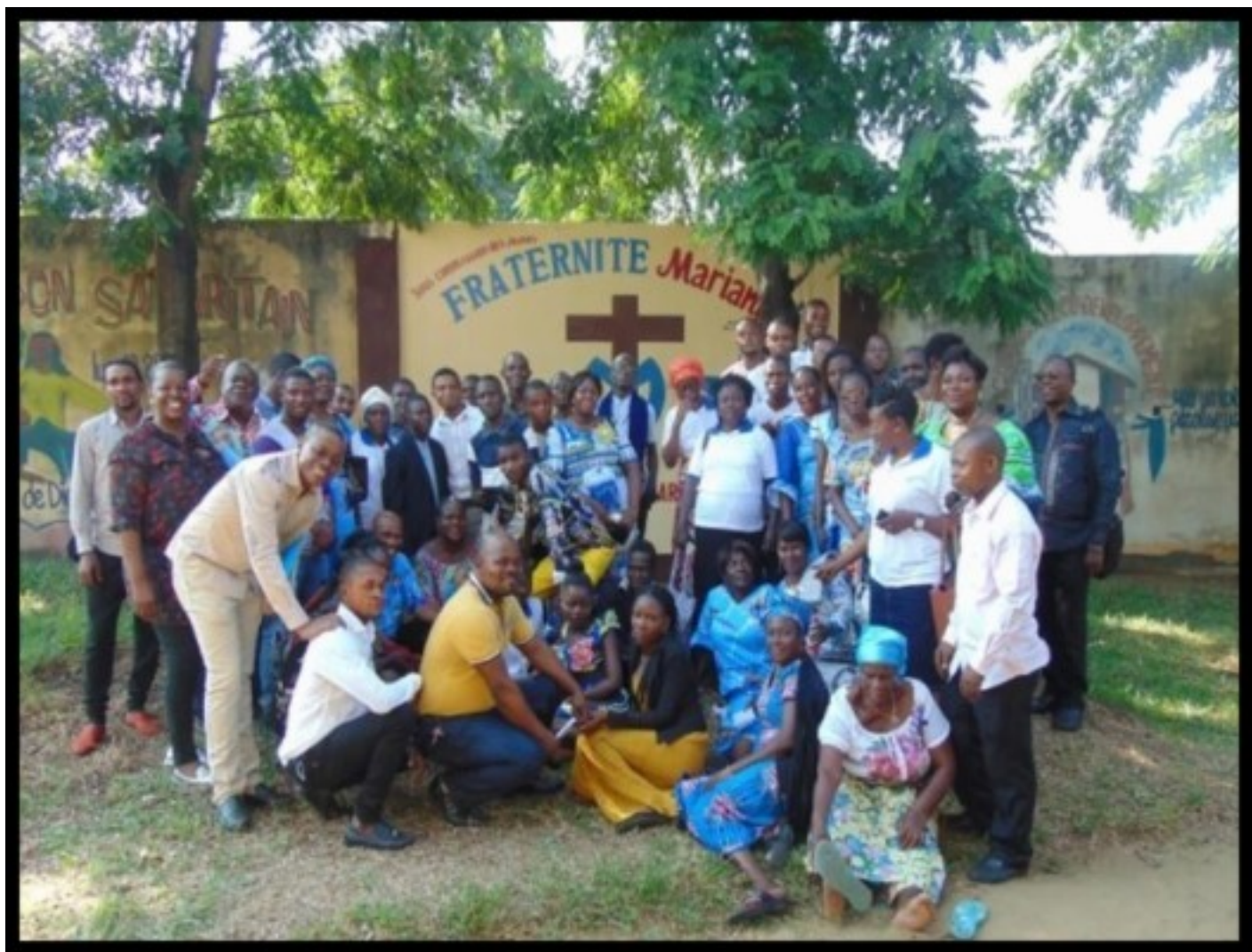
Kinshasa, République Démocratique du Congo.