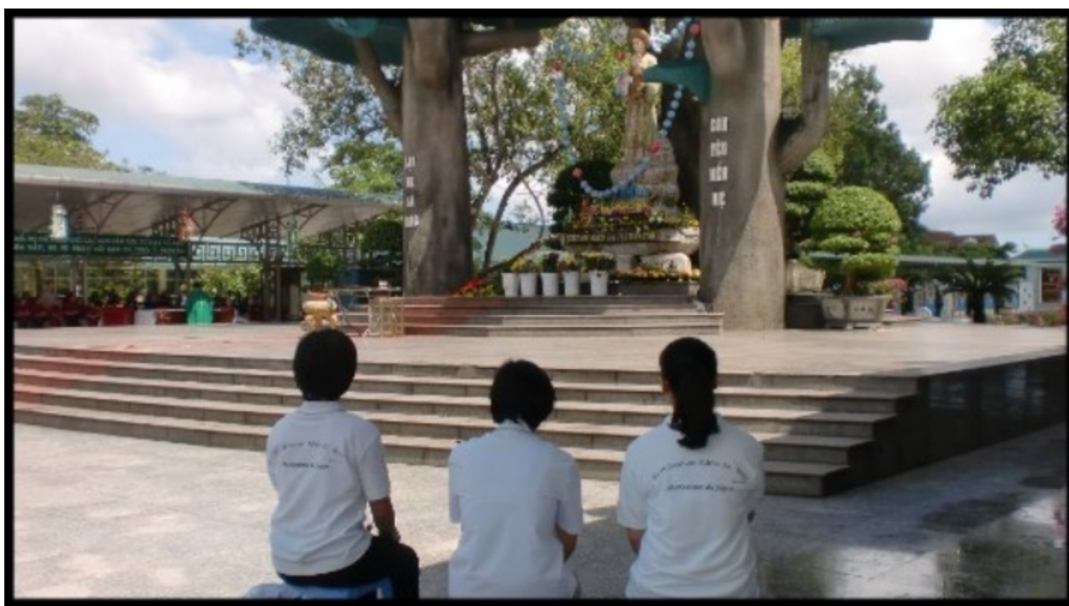
Notre-Dame de la Vang, Vietnam