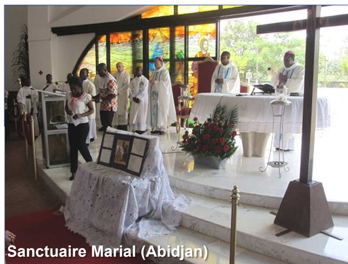
Sanctuaire Marial (Abidjan)