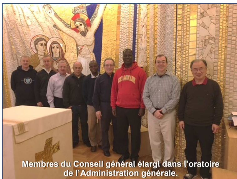
Membres du Conseil général élargi dans l'oratoire de l'Administration générale.