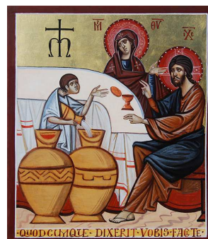
Les noces de Cana.

Le ministère auquel le Seigneur nous appelle a pour finalité de faire vivre les hommes dans la plénitude de cette filiation divine. C'est le sens de notre service à Dieu et aux autres, à la suite de Jésus, serviteur de tous. C'est le sens du service des sacrements, de la parole, de la charité, qui sont inséparables.