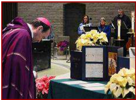
L'archevêque de Cincinnati vénère l'icône à Dayton.

Du fait que c'est le même objet qui passe quasiment à tous les lieux marianistes du monde, ce Triptyque devient un signe particulier d'unité. Dans ce numéro de Via Latina 22, nous vous présentons quelques photos du pèlerinage du Triptyque, et nous vous invitons à visiter le site internet du bicentenaire à www.marianist.org pour des informations complémentaires. Puisse cette célébration continuer à produire ses fruits pour tous les Marianistes et ceux qu'ils servent ! ►